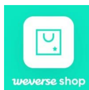
Gambar 1 Logo Weverse Shop

Aplikasi Weverse Shop membuatnya sederhana Akuisisi item BTS sejati seperti koleksi, DVD, BT21 (item upaya bersama BTS dengan Merek line companions), serta produk menunjukkan. Ada satu informan yang menambahkan bahwa aplikasi ini adalah tempat di mana Anda dapat menghabiskan uang yang Anda miliki. Semua informan berbagi pendapat ini. Seperti aplikasi e-commerce secara umum, semua informan sepakat bahwa aplikasi toko Weverse mudah digunakan, tanpa langkah atau kesulitan. Penggunaan aplikasi Weverse Shop dapat dijelaskan secara rinci oleh semua informan. Semua responden setuju bahwa menggunakan aplikasi Weverse Shop sederhana. Kesulitan yang dihadapi pengguna khususnya kesalahan yang dibuat selama pembelian barang dagangan terbatas - semua informan menyebut ini sebagai "merch war." Barang dagangan perang terjadi saat itu penawaran berbagai produk dengan jumlah terbatas dengan tujuan yang harus dibeli pembeli. Melakukan kebutuhan barang dagangan perang Asosiasi web cepat untuk bersaing dengan penggemar yang berbeda di seluruh planet ini Dalam membeli item.