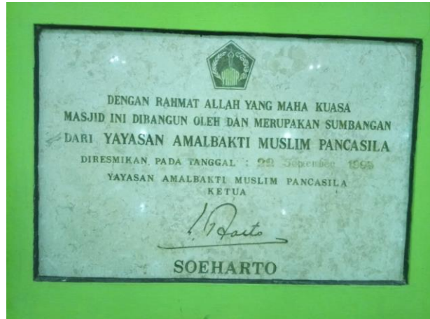
Gambar 4.1 Prasasti Peresmian Masjid Nurul Hudud

Menurut H. M Yunus, Masjid Nurul Huda lokasinya terletak di antara pemukiman masyarakat Muslim. Akan tetapi, tidak dapat dilakukan pemegaran karena letak masjid ini berdiri menanjak bukit yang berbatu (wawancara Yunus, 56 Tahun pada tanggal 24/07/2019) 2 . Sehingga, masjid ini dialih fungsikan ke lokasi yang lebih besar, yakni masjid Nurul Hudud.