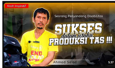
Gambar 3. Jalan Hidupku Channel