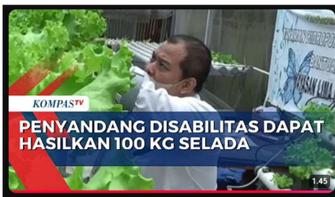
Gambar 4. KompasTV Channel