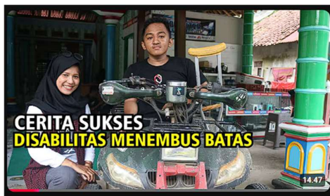
Gambar 2. Baromedia Channel